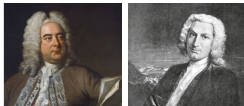
Georg Friedrich Händel Jan Dismas Zelenka